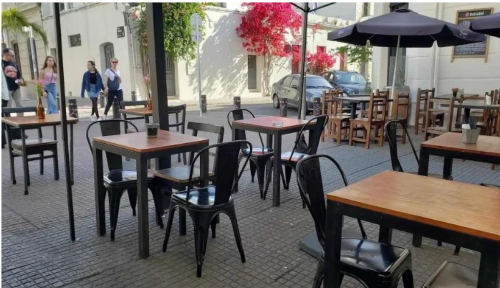
Alvarez bar todas