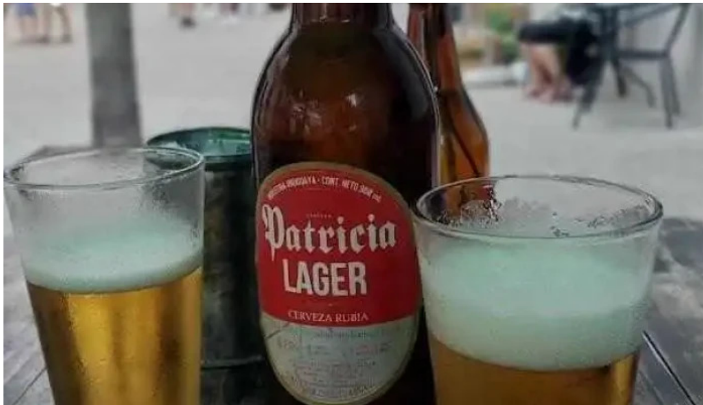
Alvarez bar cerveza