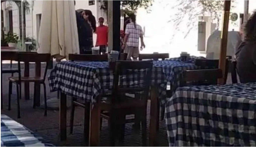
Alvarez bar videos