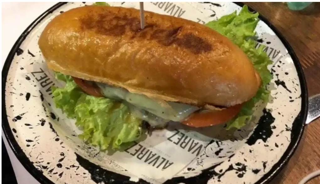
Alvarez bar sandwich de pollo