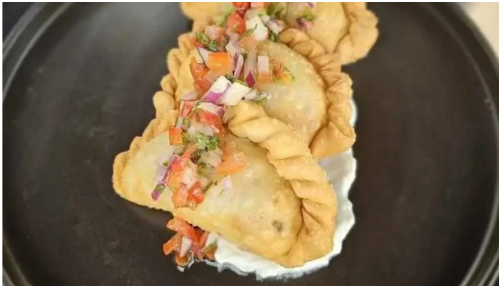
Alvarez bar mas recientes