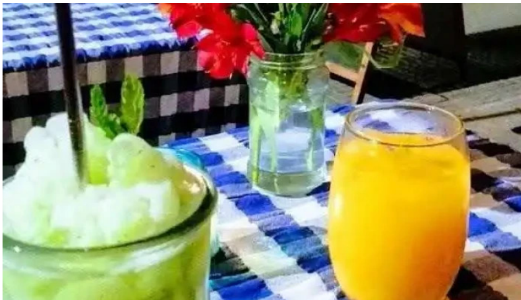
Alvarez bar jugo