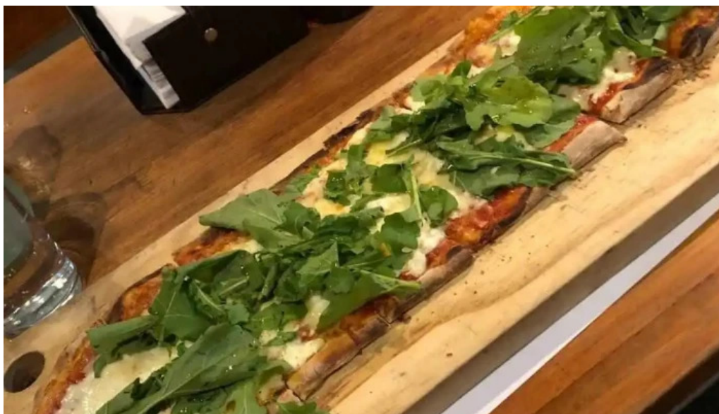
Alvarez bar pan plano