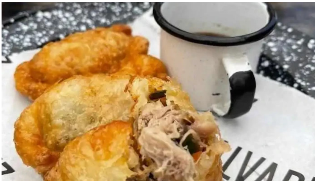
Alvarez bar comida y bebida