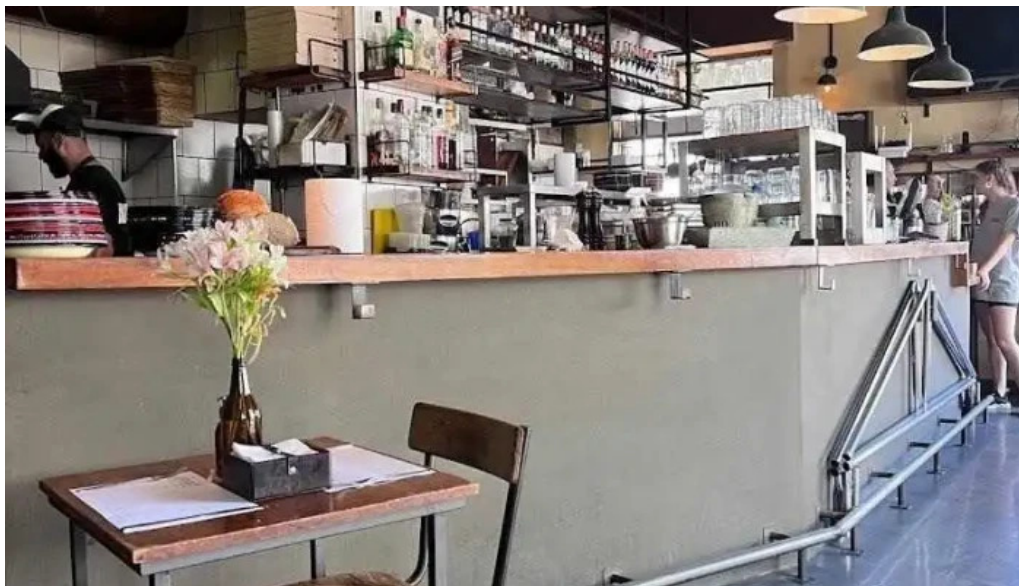
Alvarez bar ambiente