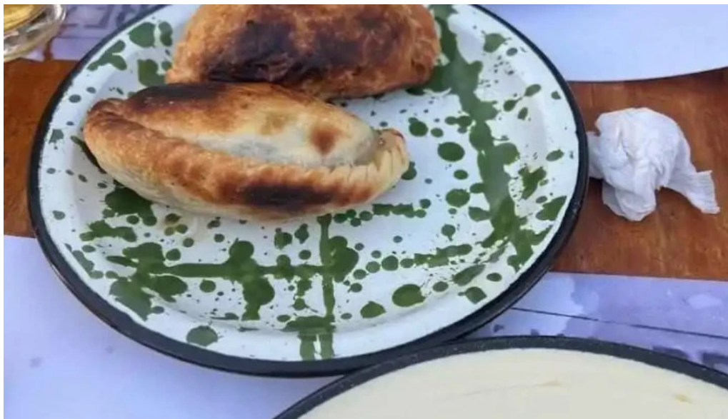
Alvarez bar empanada