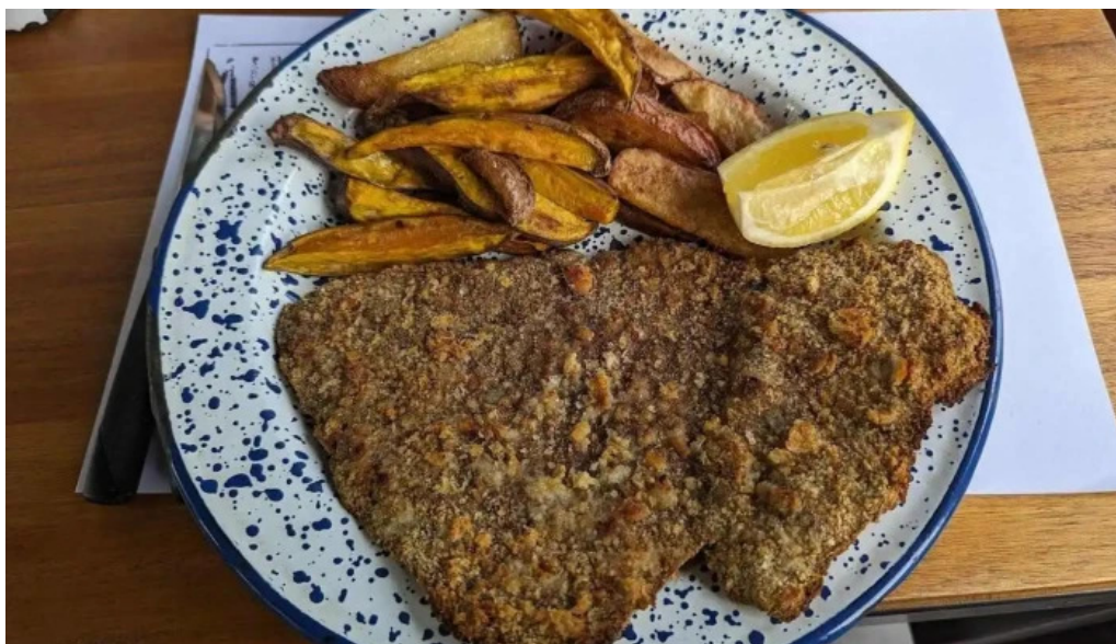
Alvarez bar san jacobó