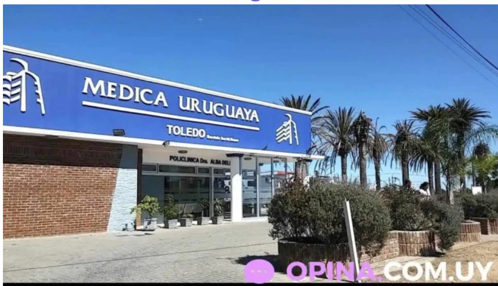
Medica uruguay filial toledo toledo