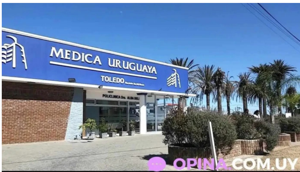
Medica uruguay filial toledo descuentos