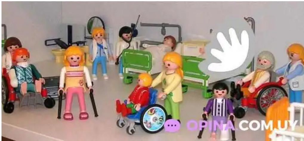
Ortopedia de la costa numero