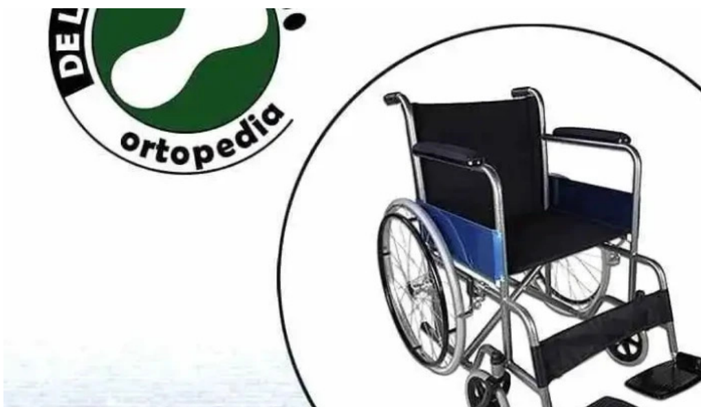
Ortopedia de la costa del propietario