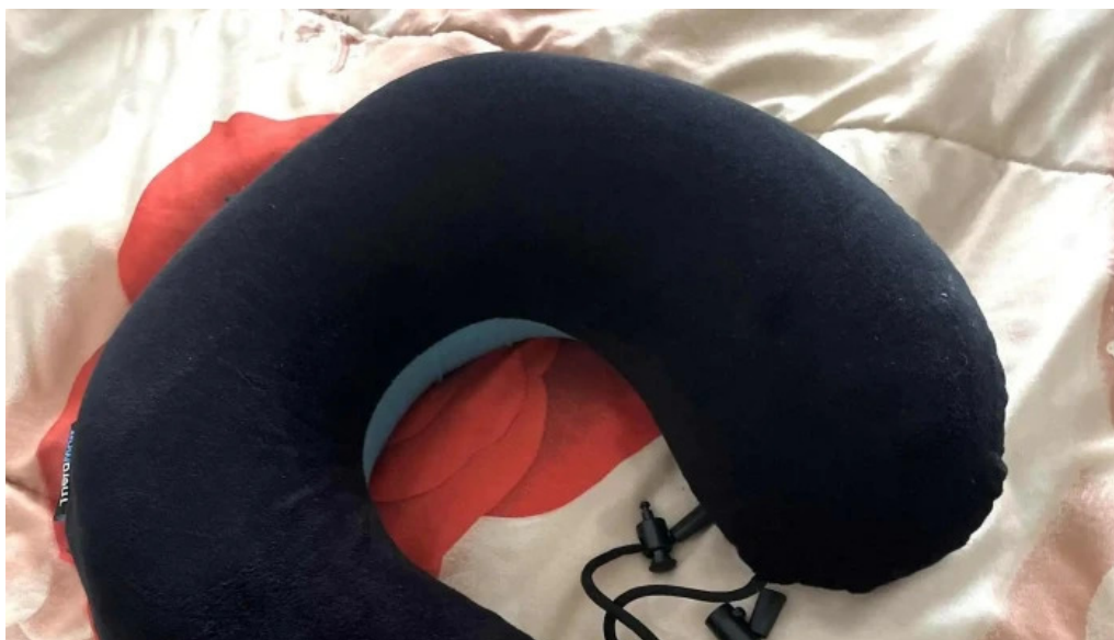
Ortopedia de la costa ciudad de la costa