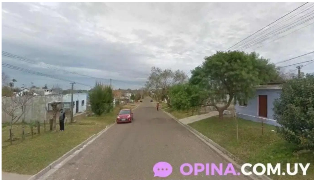
Radio un encuentro con dios melo