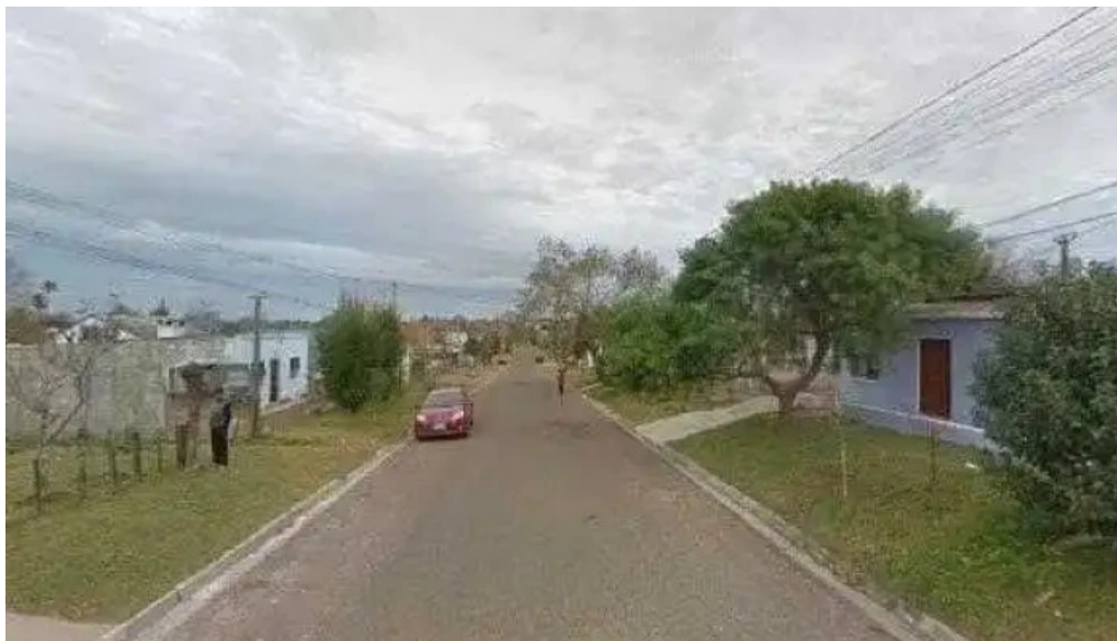
Radio un encuentro con dios sitio web