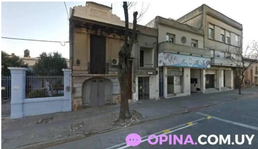
Instituto evart monteideo