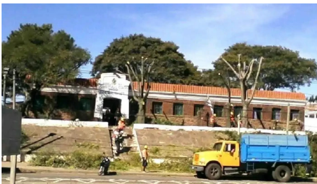
Escuela no 9 cristobal colon comentarios