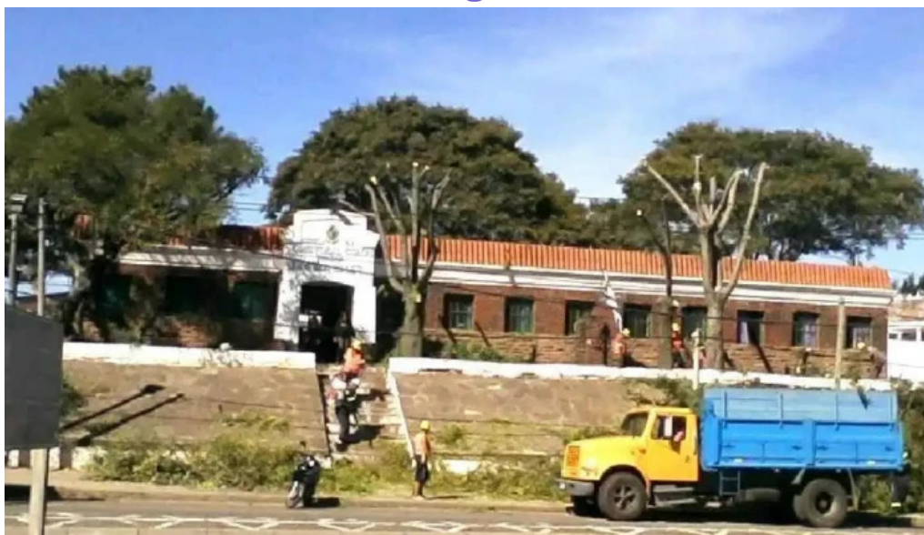
Escuela nº 9 cristobal colon rivera