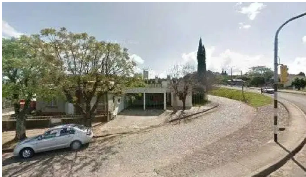
Escuela no 9 cristobal colon comentariosdeg