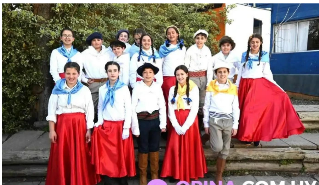
Colegio y liceo san gabriel estudiante