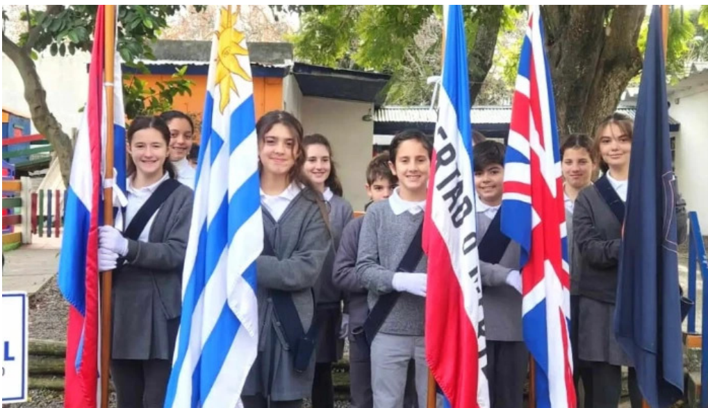
Colegio y liceo san gabriel videos