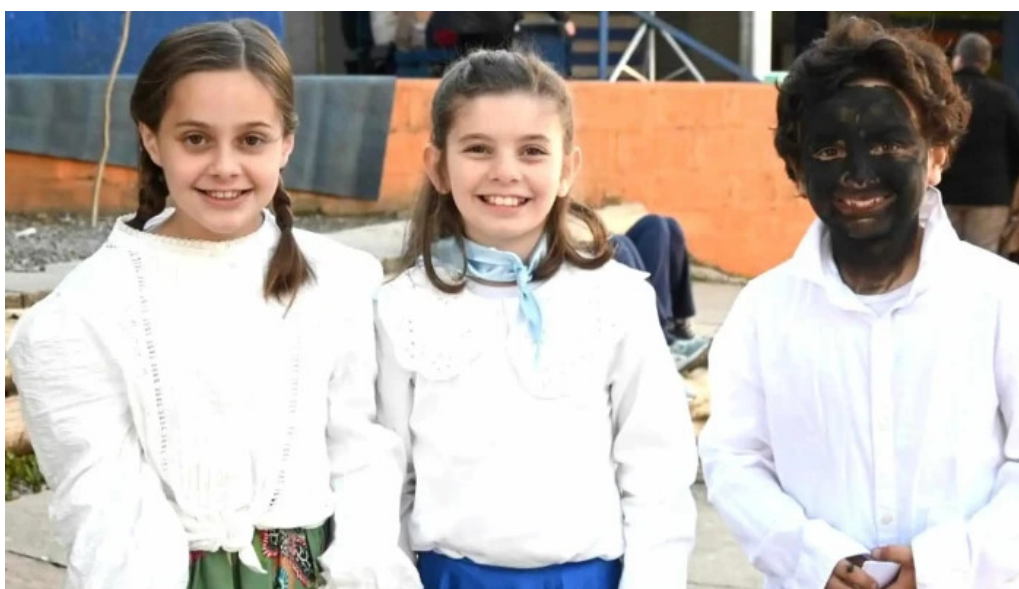
Colegio y liceo san gabriel cerca de mi