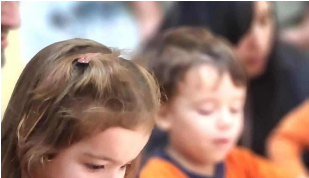
Colegio y liceo san gabriel zona