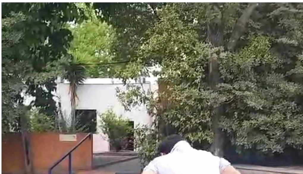
Colegio y liceo san gabriel col del sacramento