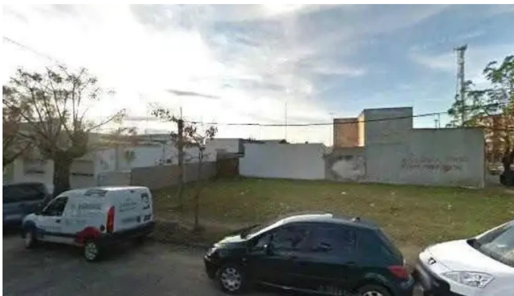
Escuela ndeg90 zonadeg