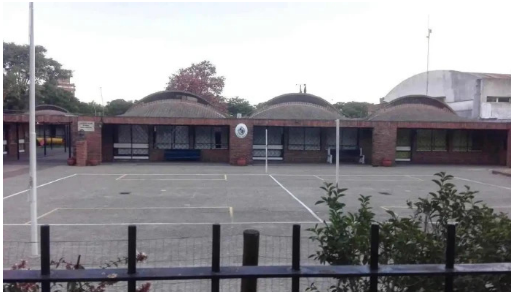
Escuela n°90 col del sacramento