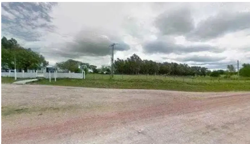
Escuela degn43 espinillo promociondeg