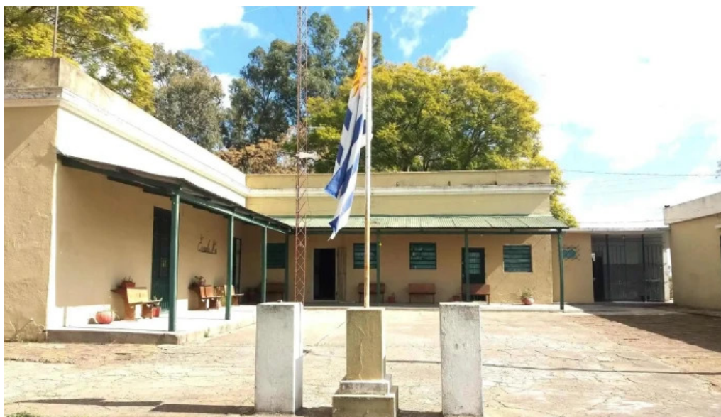
Escuela degn43 espinillo promocion