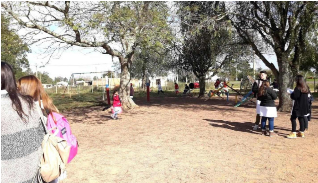
Escuela 57 paso ancho ejido de treinta y tres