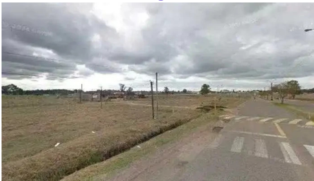
Escuela 57 paso ancho ubicaciondeg