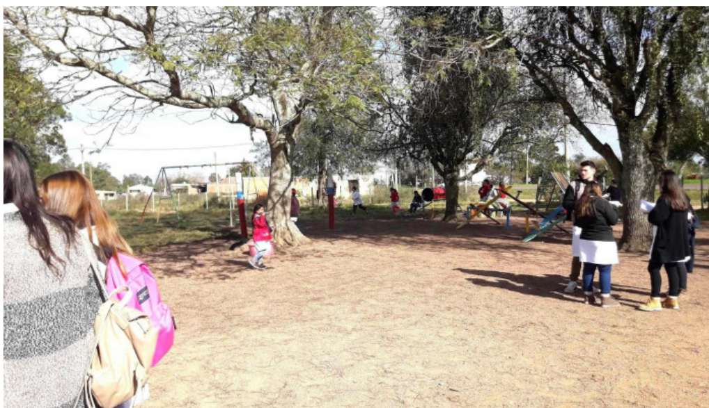
Escuela 57 paso ancho ubicacion