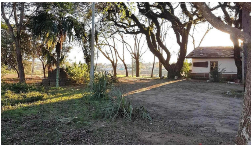
Escuela agraria utu zona