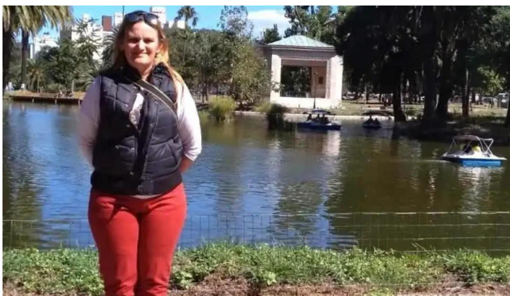
Escuela ndeg46 telefono