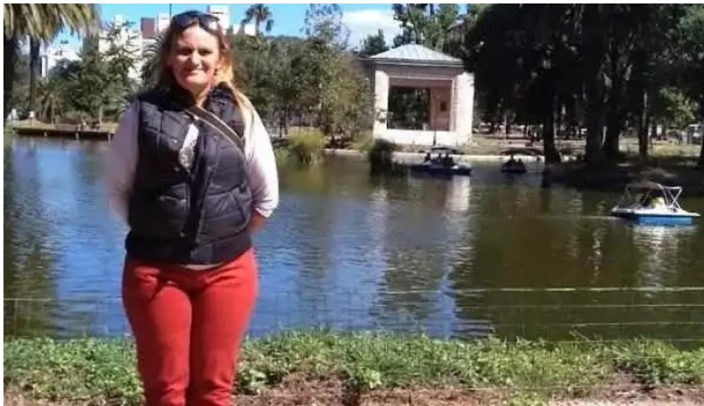
Escuela n°46 san jose de mayo