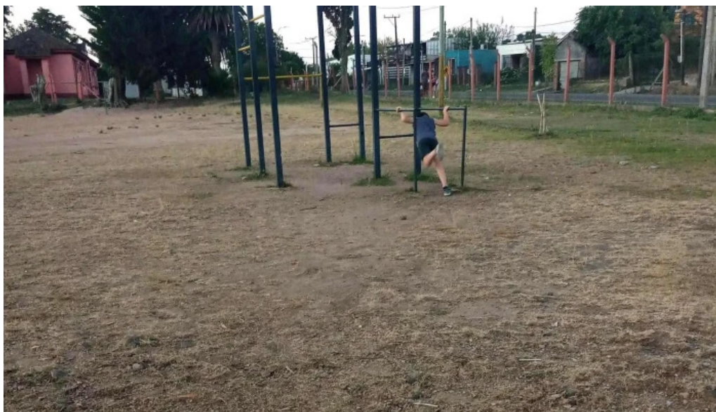
Plaza de deportes toledo toledo