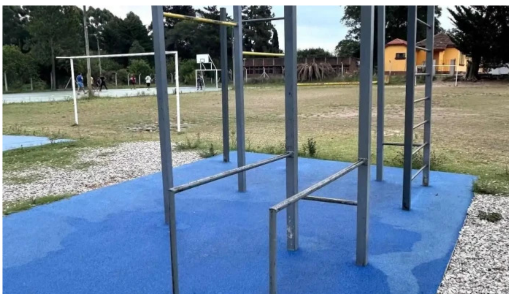
Plaza de deportes toledo sitio web