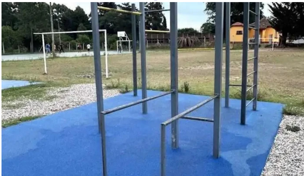
Plaza de deportes toledo toledo