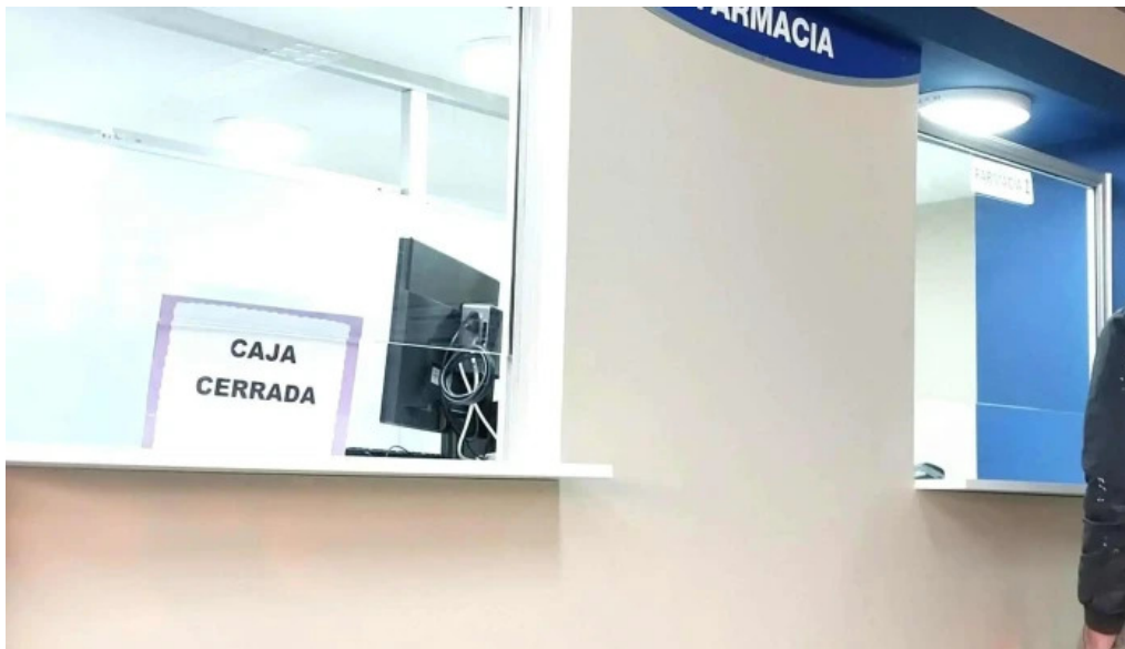
Medica uruguaya atlantida