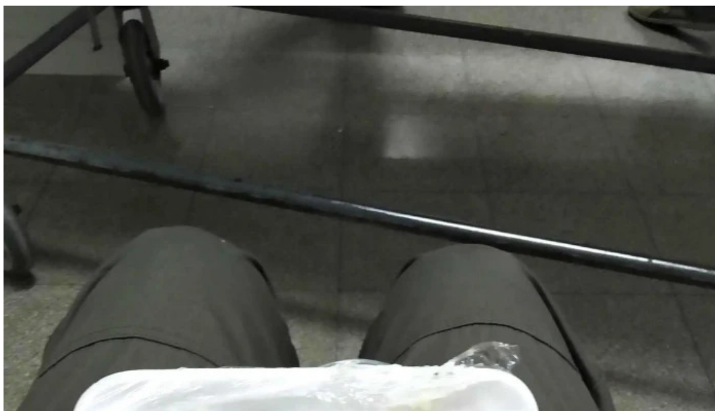
Hospital de melo como llegar