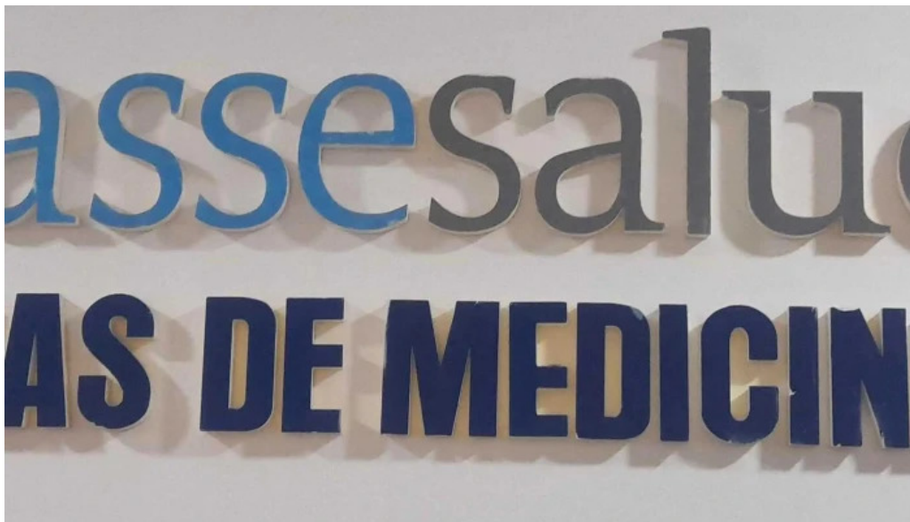
Hospital de melo melo