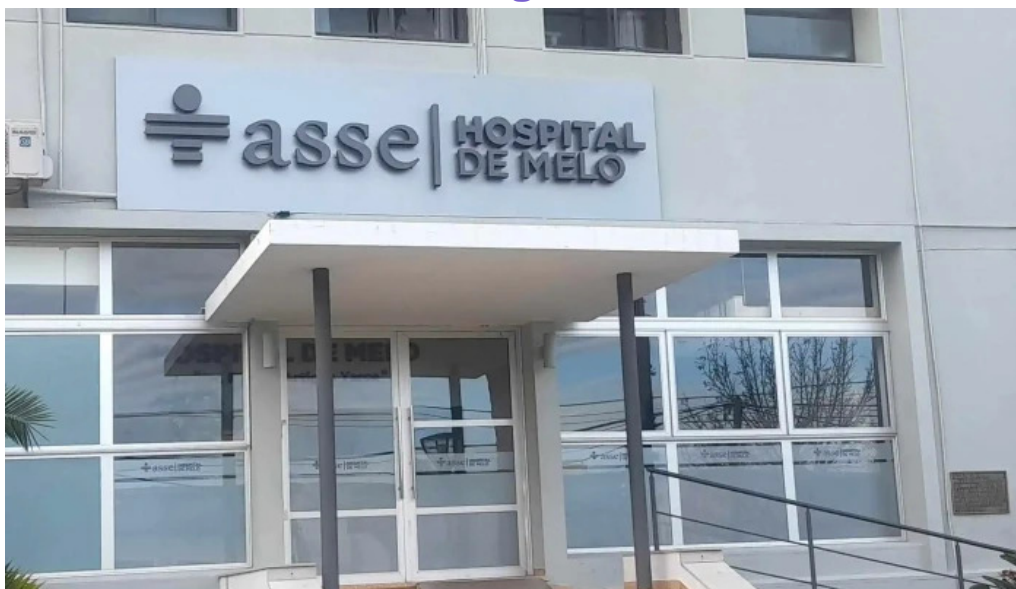
Hospital de melo videos