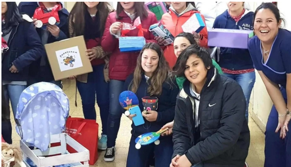
Hospital de melo descuentos