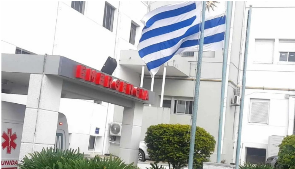
Hospital de melo sitio web