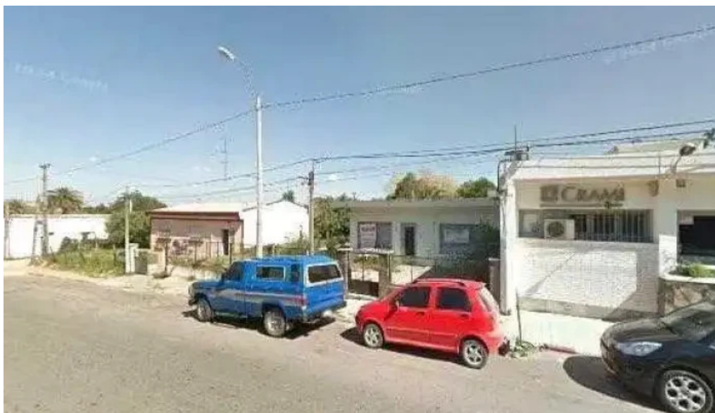
Policlinico crami sauce promocion