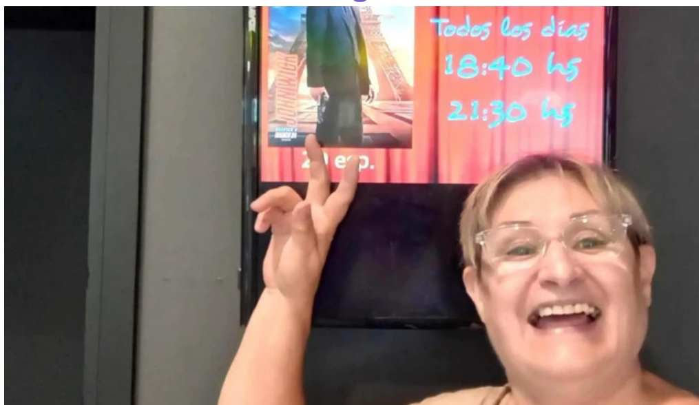
Libros libros ubicacion