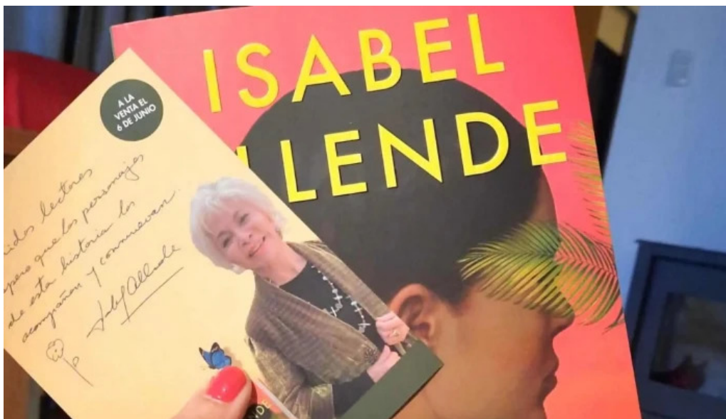
Libros libros catalogo