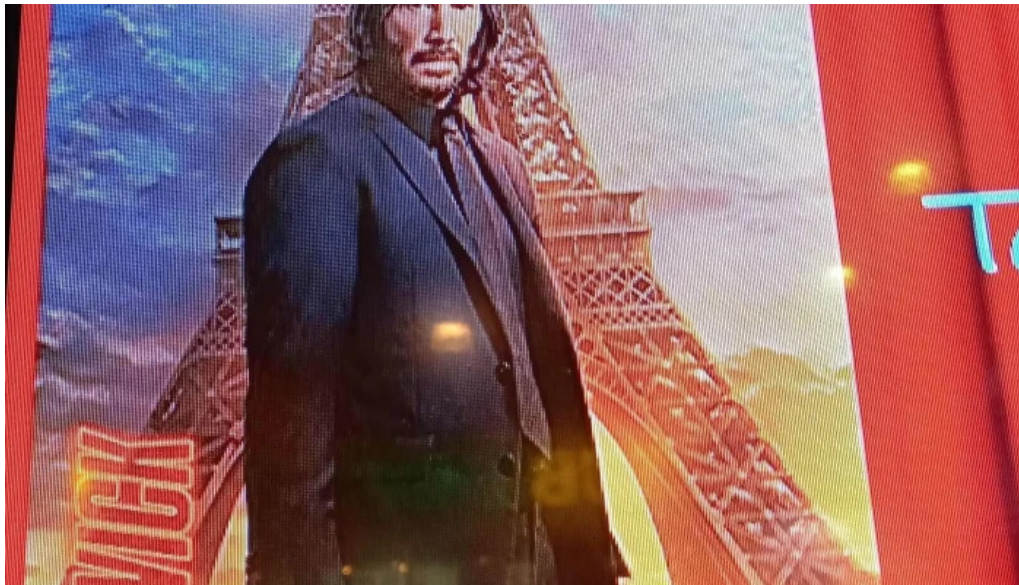
Libros libros col del sacramento