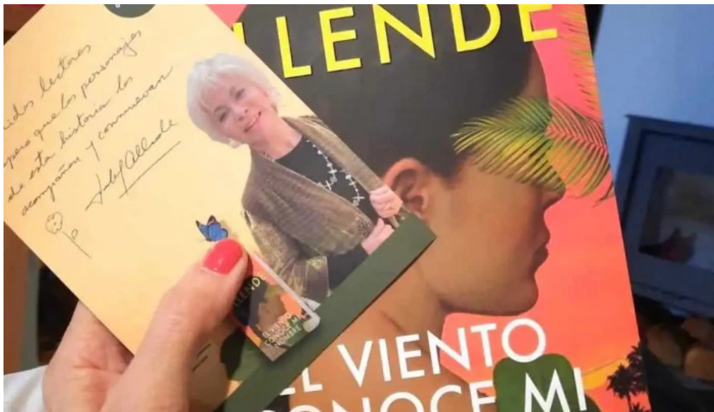
Libros libros libro