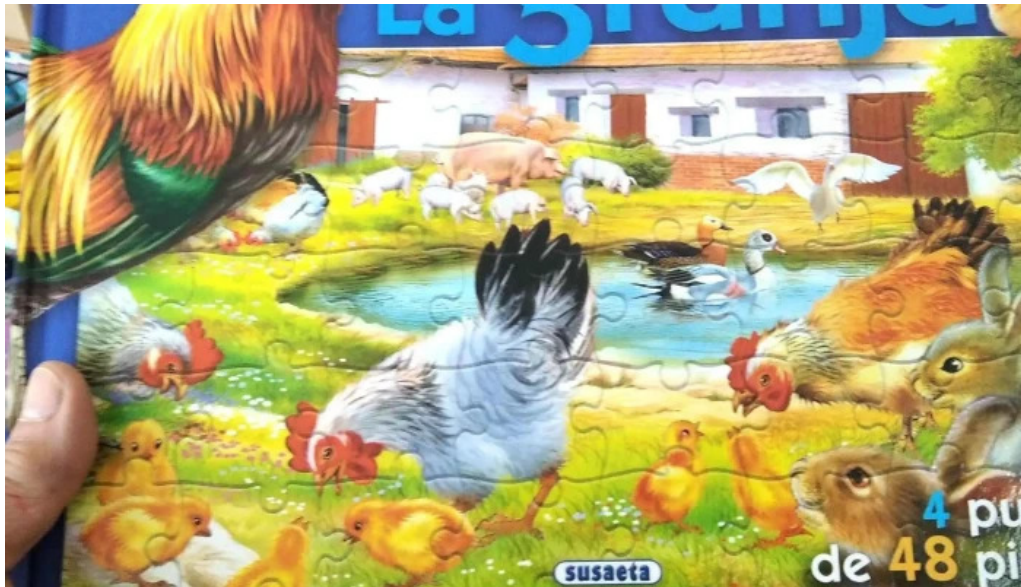
Libreria letras las piedras