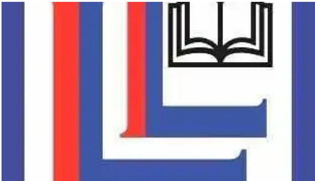
Libreria letras del propietario