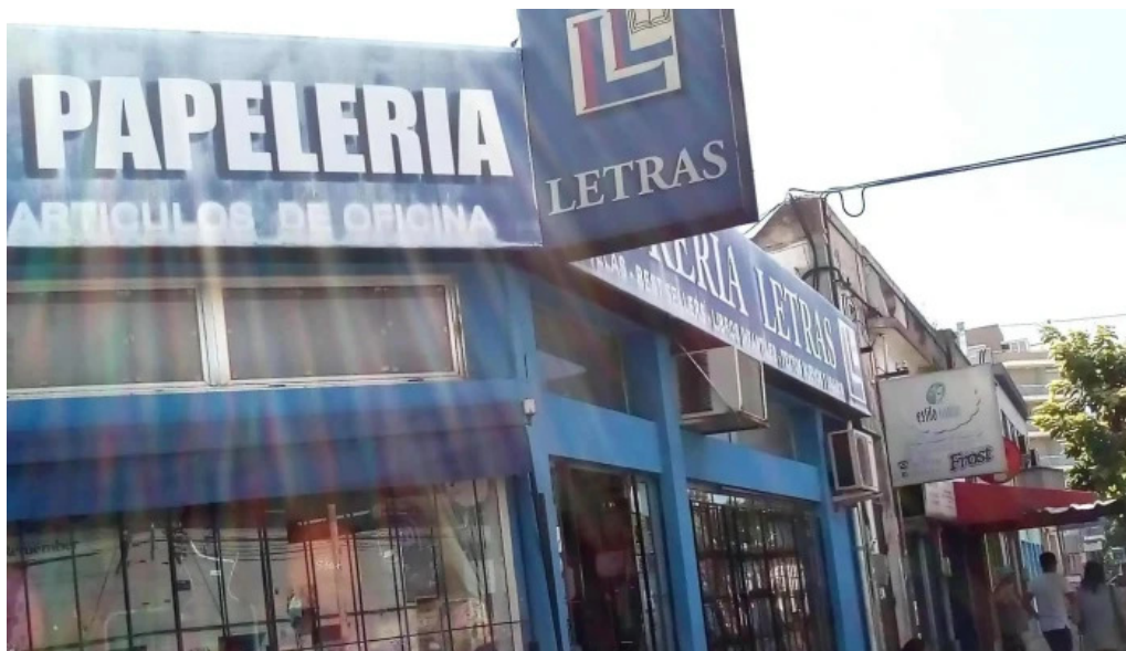
Libreria letras numero