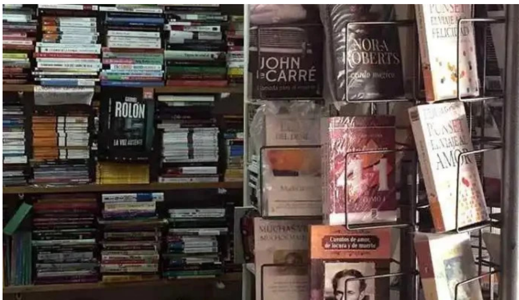
Salon abc interior