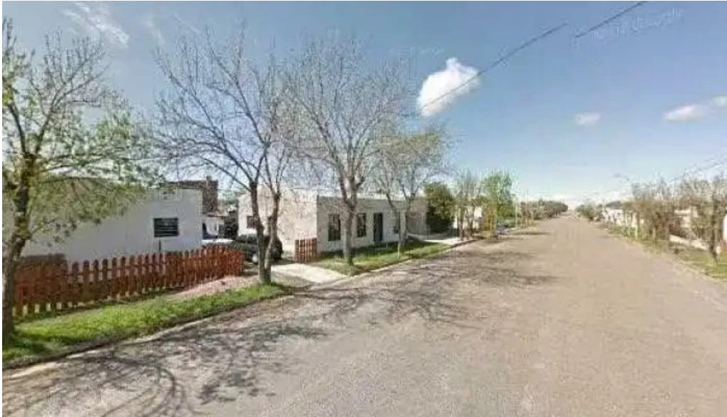
Salon abc preciosdeg