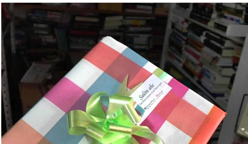
Salon abc estante de libros