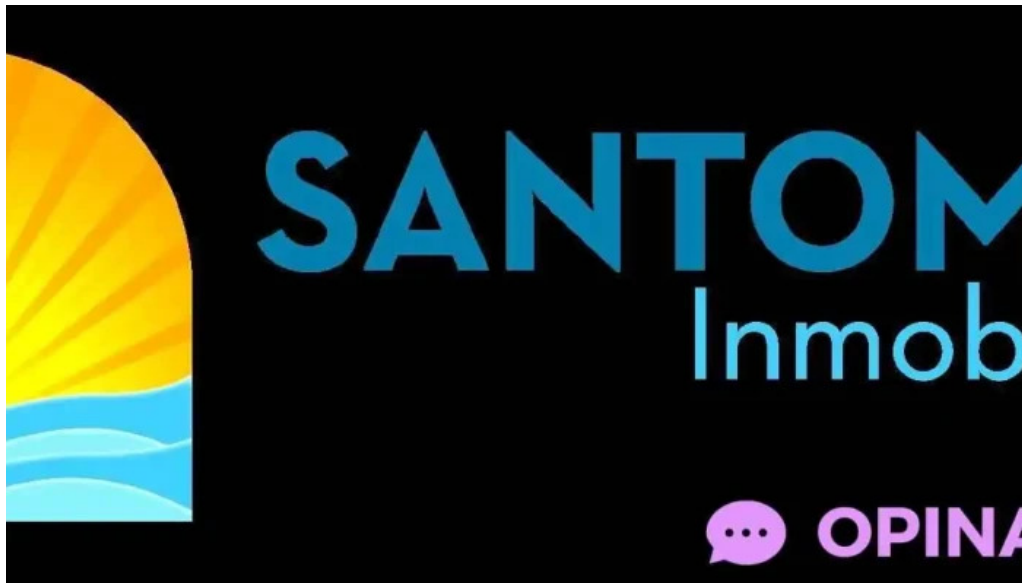
Santomar parque del plata