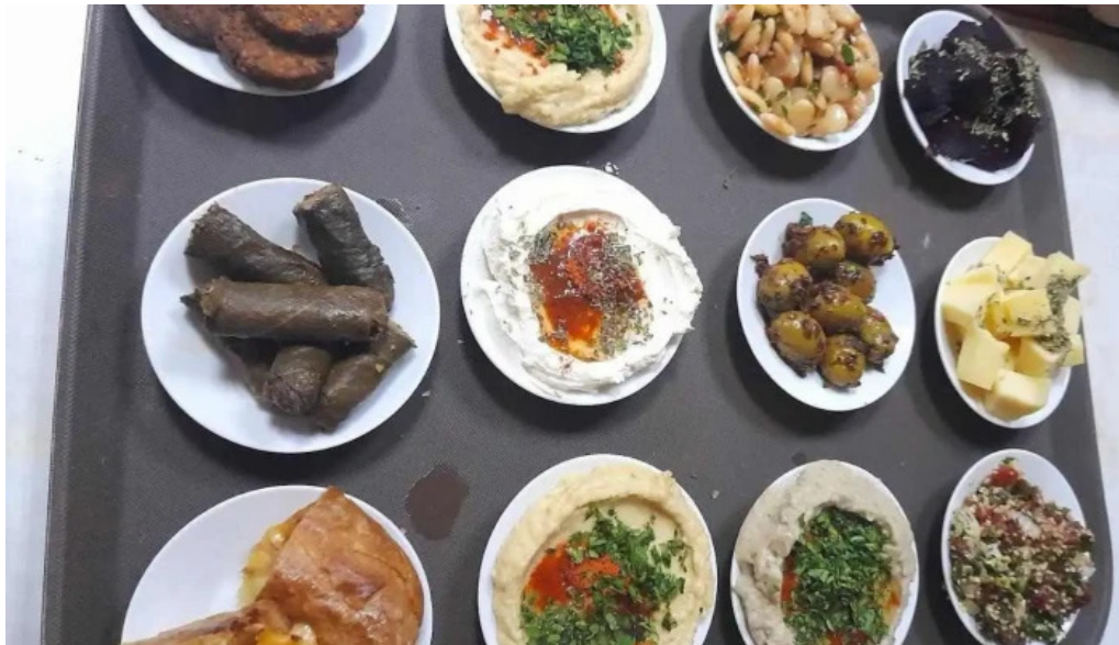
Mi casa comidas armenias meze