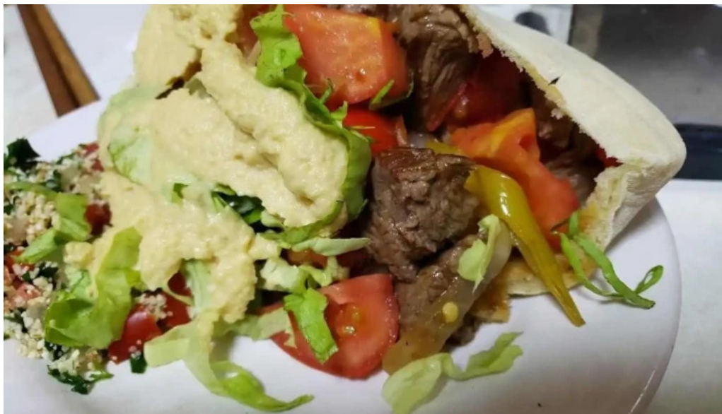
Mi casa comidas armenias pan de pita