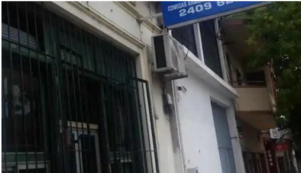
Mi casa comidas armenias la comercial