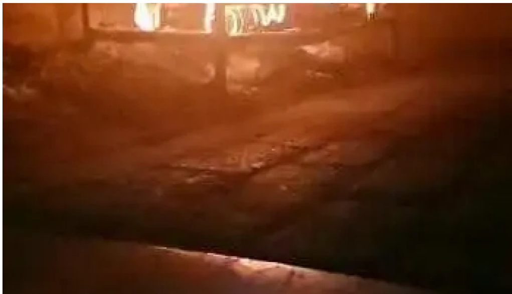
Mi casa comidas armenias del propietario