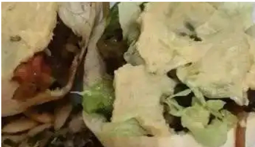
Mi casa comidas armenias videos