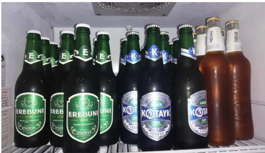
Mi casa comidas armenias comida y bebida