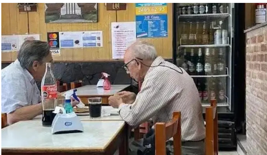
Mi casa comidas armenias ambiente