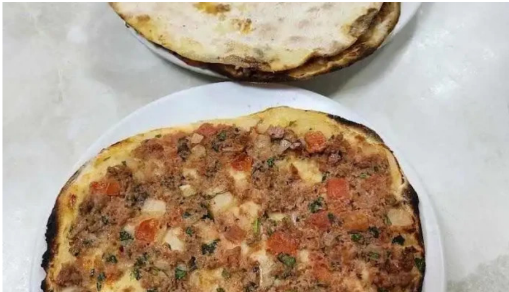
Mi casa comidas armenias lahmacun