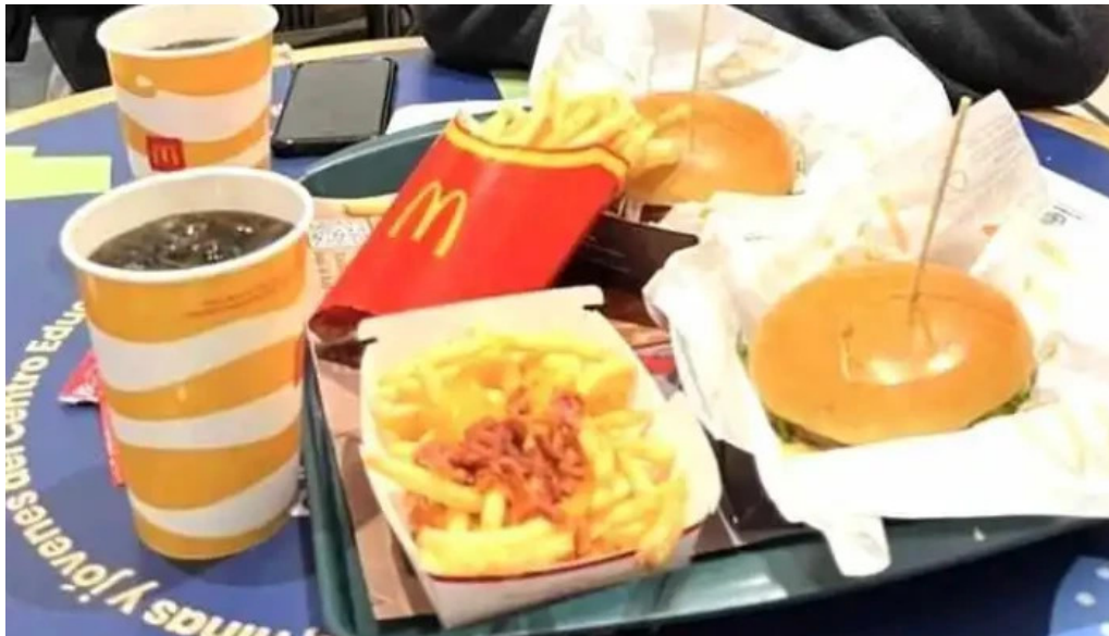
McDonalds comida reconfortante