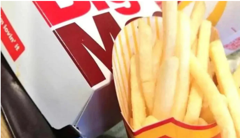
McDonalds papas fritas