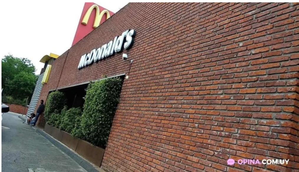
McDonald s montevideo