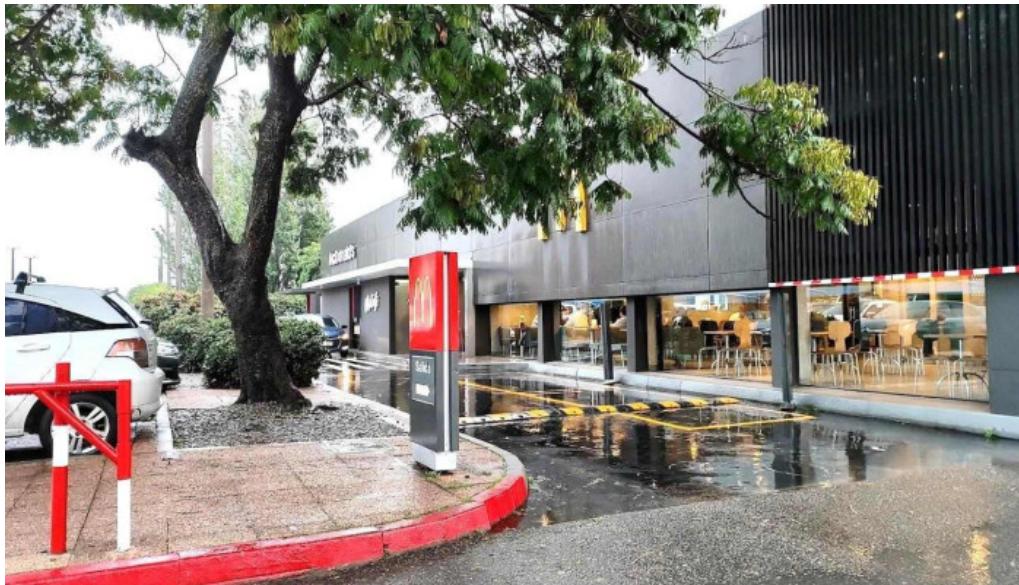
McDonalds mas recientes