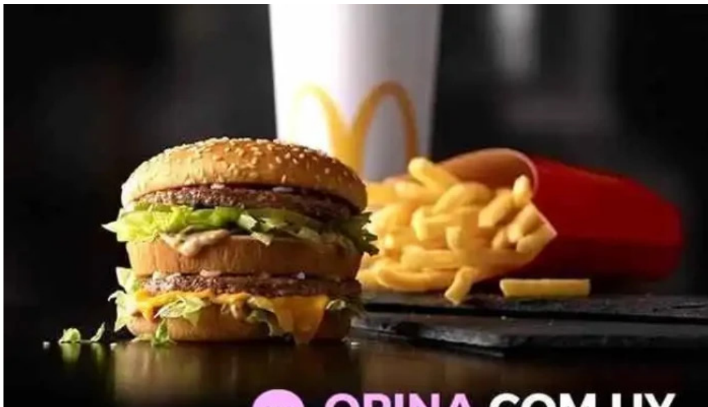
McDonalds comida y bebida