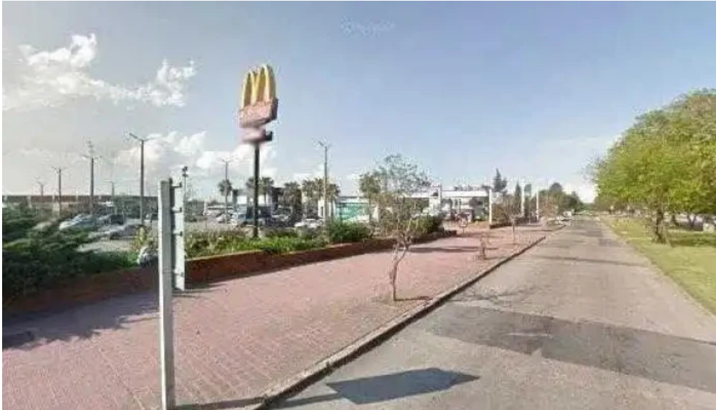
McDonalds street view y 360