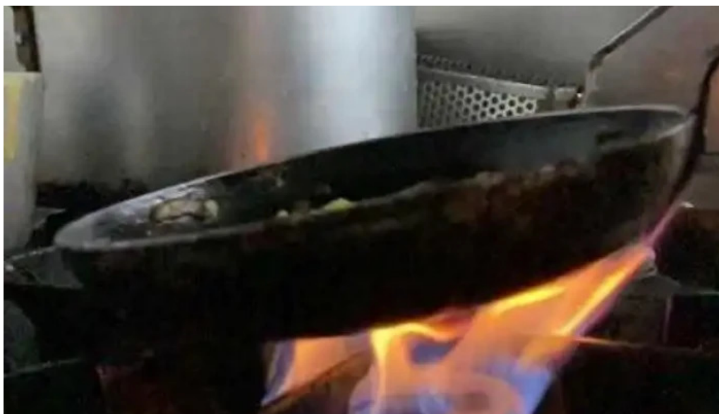
Uruguay natural parrilla gourmet del propietario