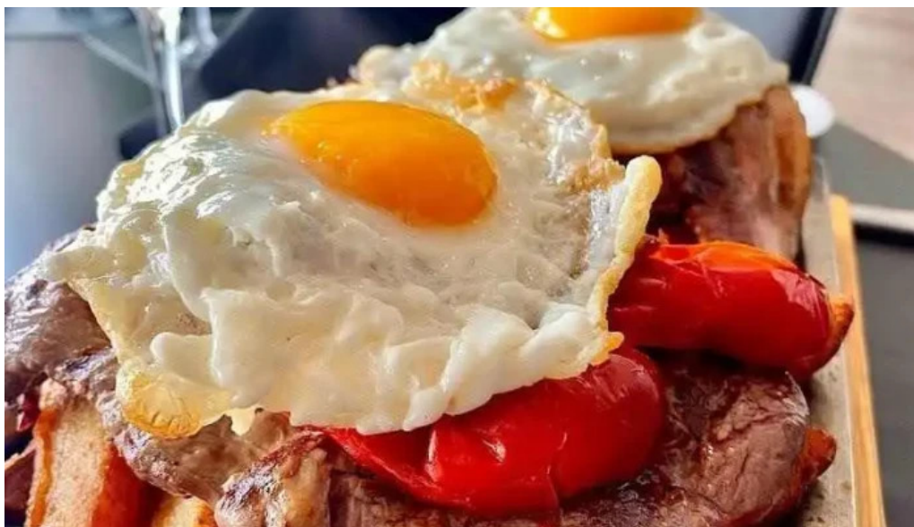
Uruguay natural parrilla gourmet comida y bebida