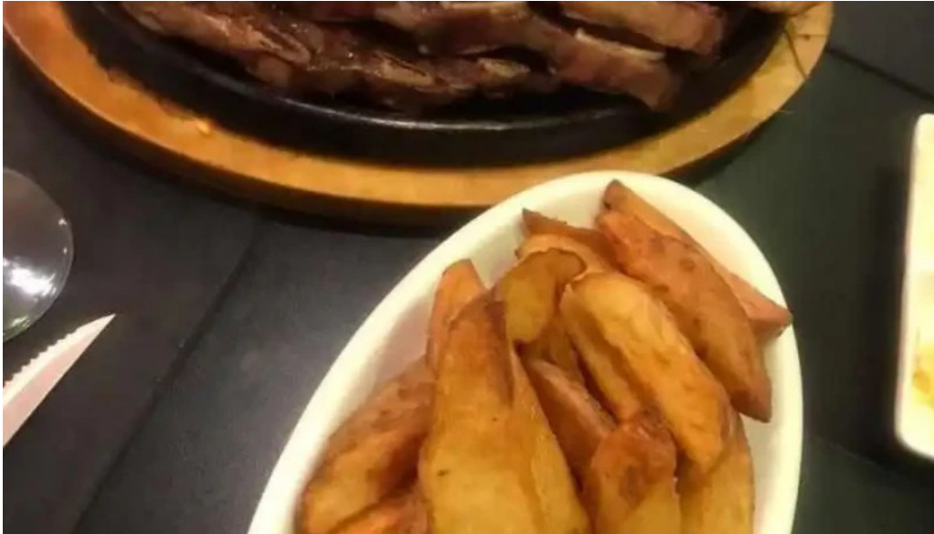
Uruguay natural parrilla gourmet patatas bravas