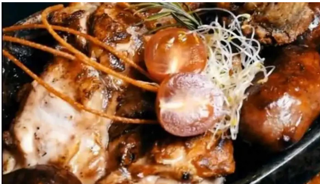
Uruguay natural parrilla gourmet videos