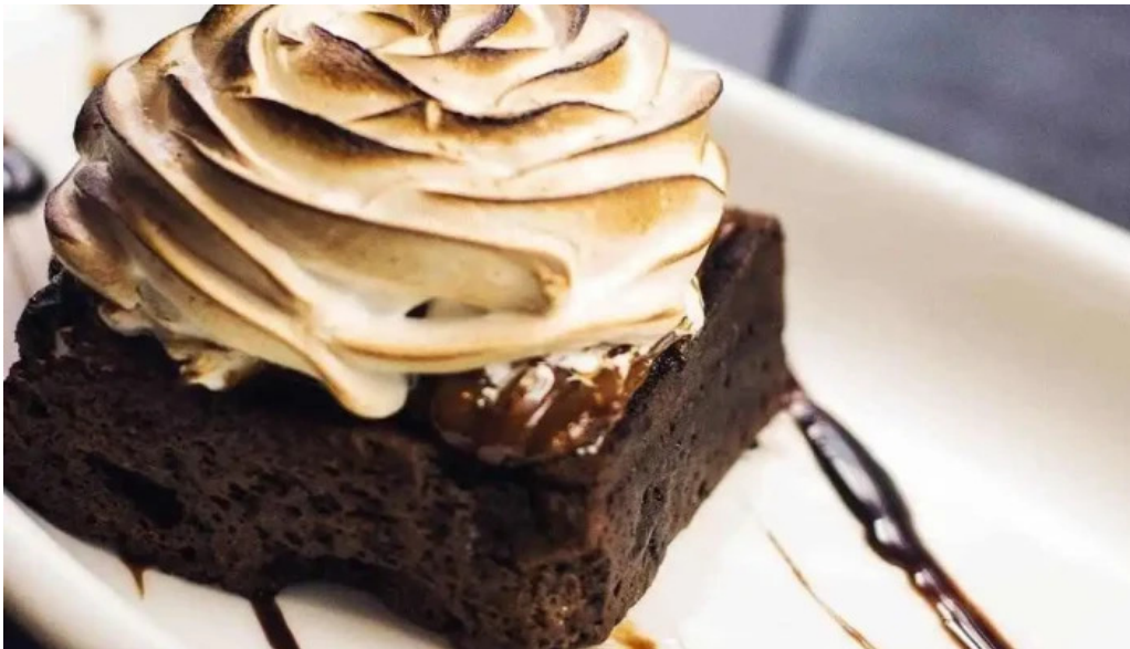
Uruguay natural parrilla gourmet brownie