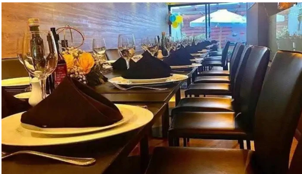
Uruguay natural parrilla gourmet todas