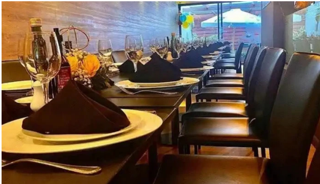
Uruguay natural parrilla gourmet montevideo