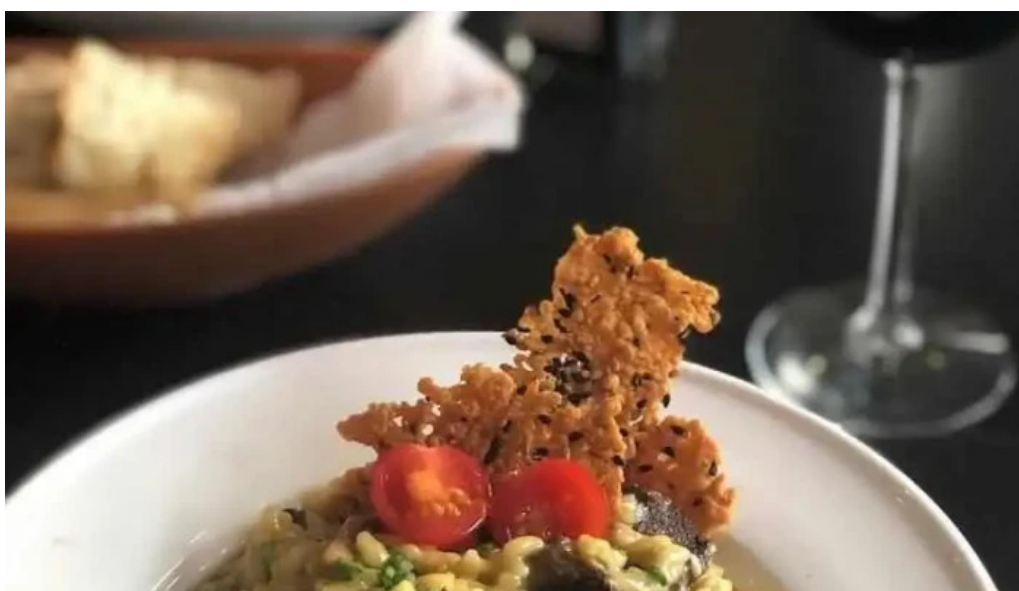
Uruguay natural parrilla gourmet risotto