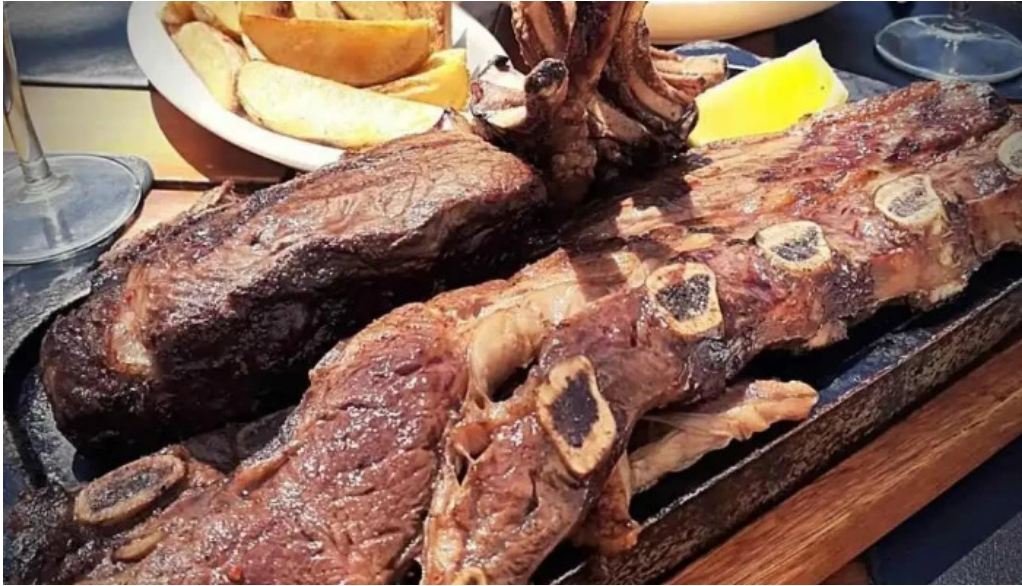
Uruguay natural parrilla gourmet churrasco