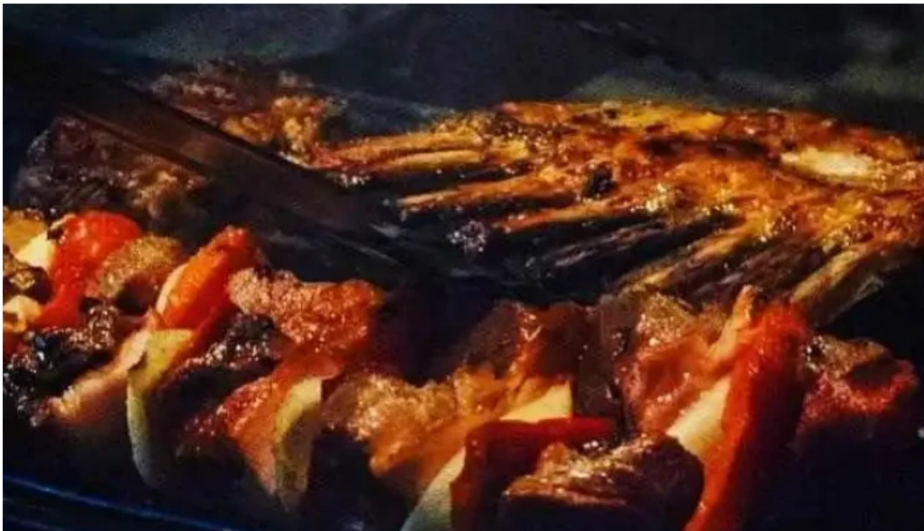
Uruguay natural parrilla gourmet parrillada