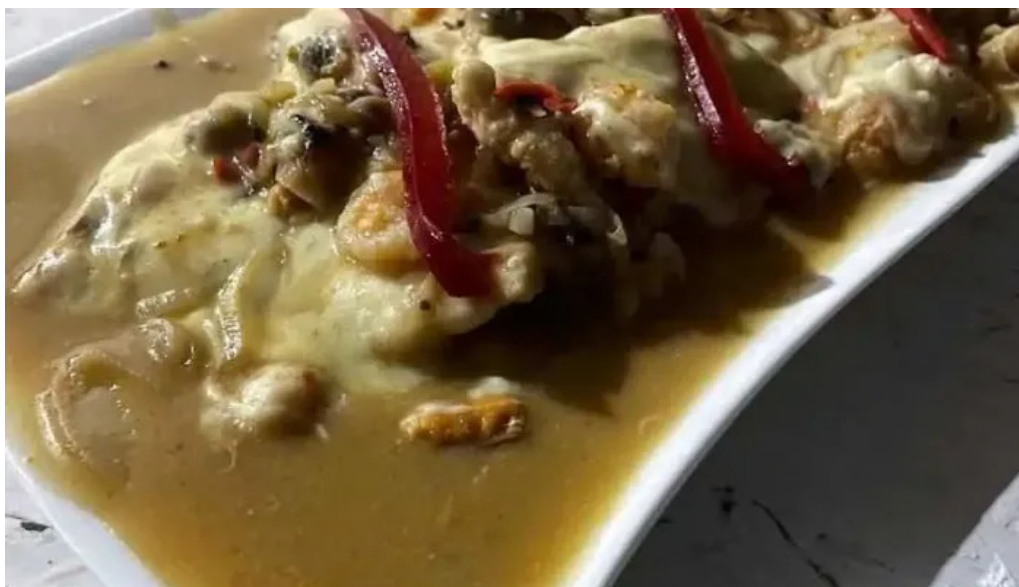
El chacarita todas