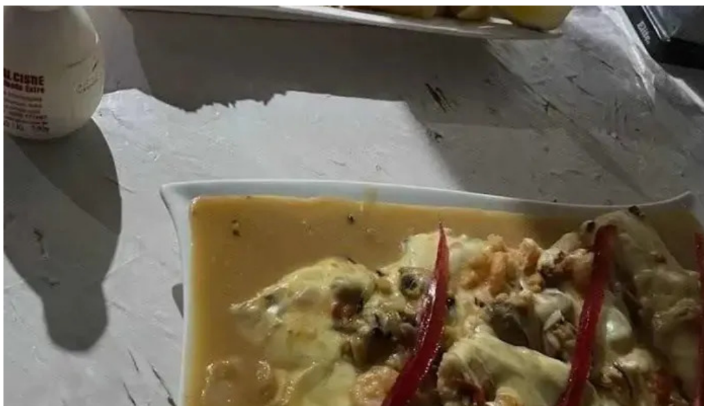
El chacarita comida y bebida