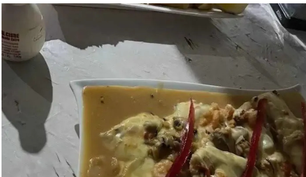
El chacarita papas fritas