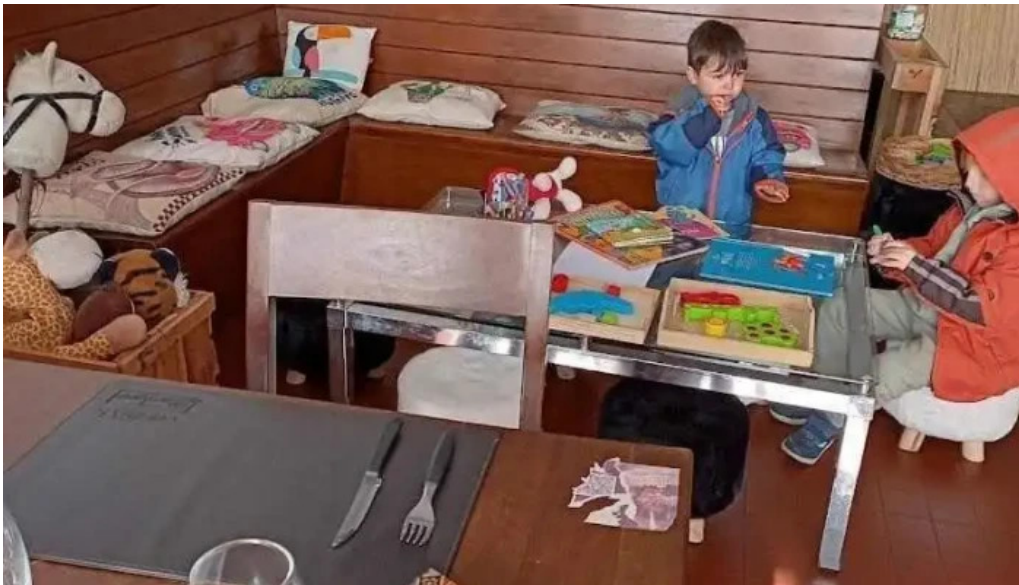
Espacio gastronomico del club aleman de remo todas