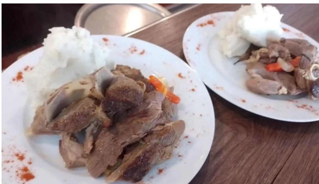
Espacio gastronomico del club aleman de remo comida y bebida