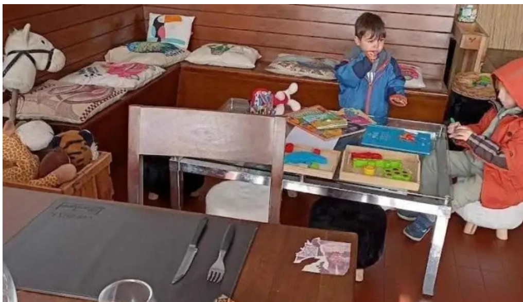
Espacio gastronomico del club aleman de remo santiago vazquez