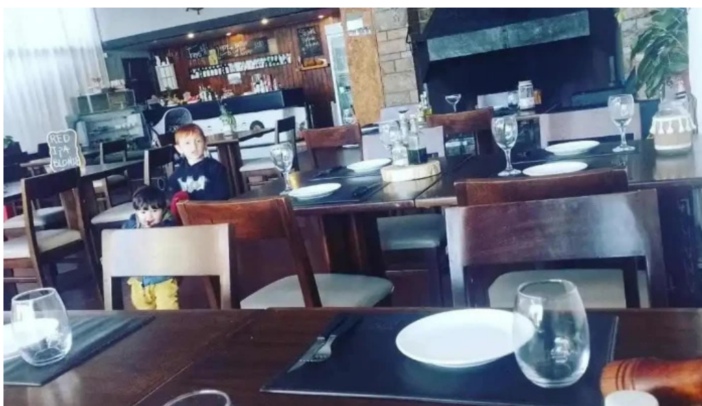
Espacio gastronomico del club aleman de remo ambiente