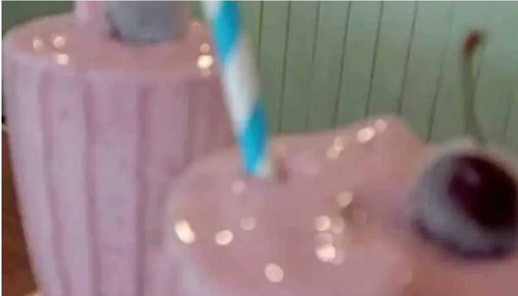
Espacio gastronomico del club aleman de remo videos