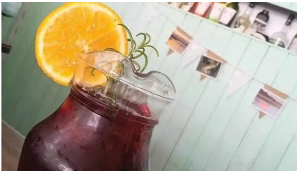
Espacio gastronomico del club aleman de remo mas recientes