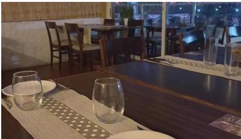
Espacio gastronomico del club aleman de remo del propietario