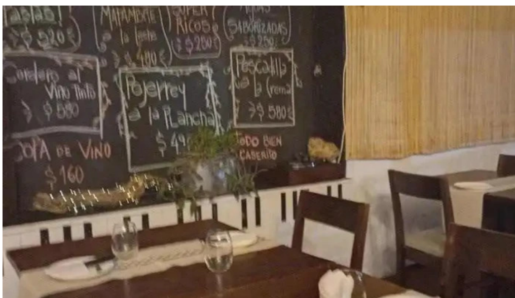
Espacio gastronomico del club aleman de remo menu