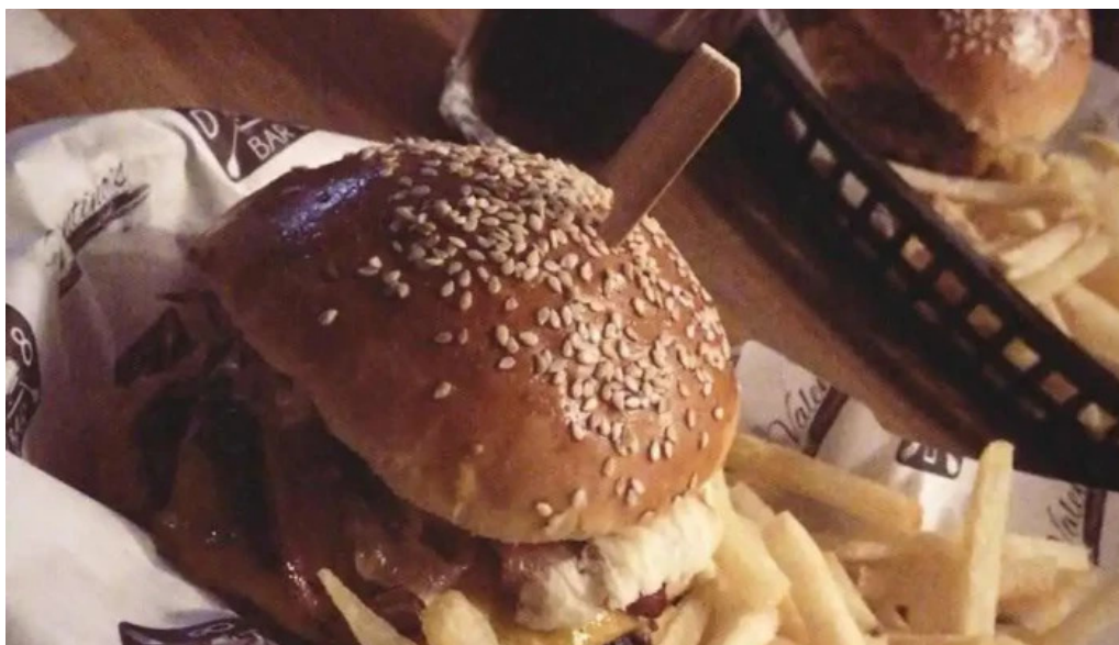
D8 food and beer house comida y bebida