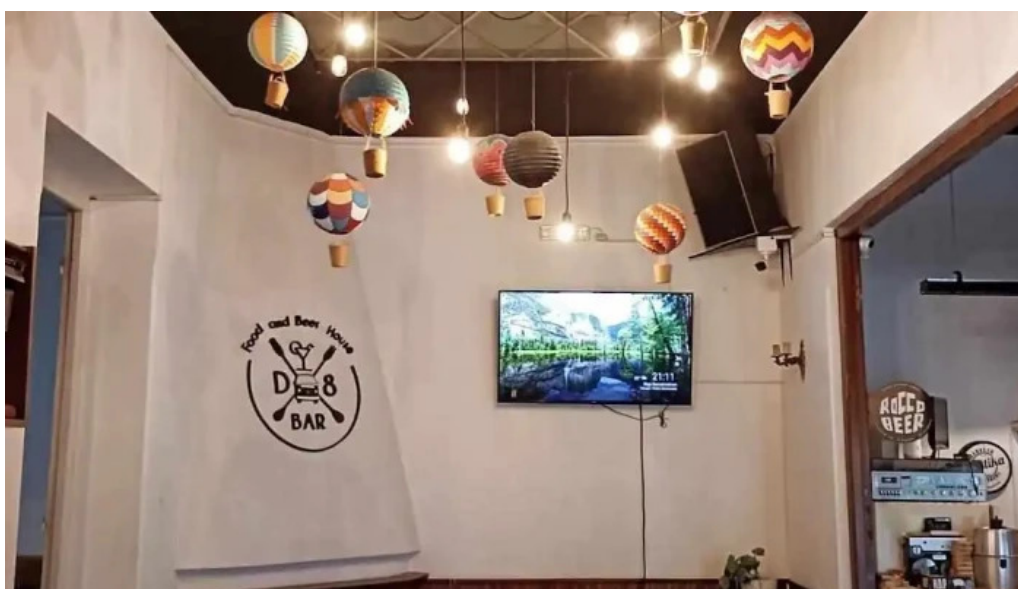
D8 food and beer house ambiente