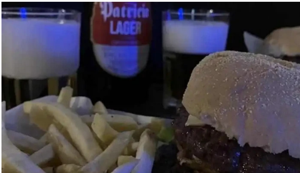
D8 food and beer house papas fritas