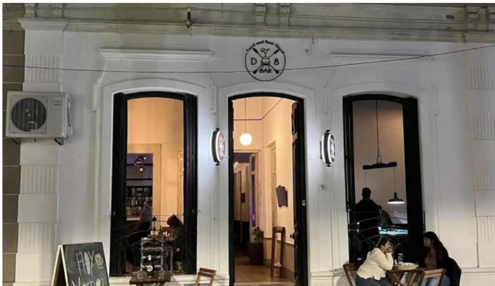
D8 food and beer house todas