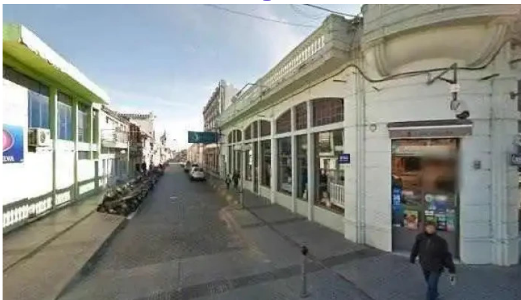
Librerías del litoral promociondeg