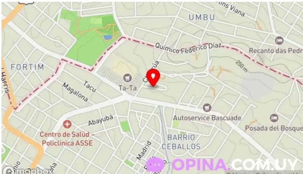
Celia pomoli mapa